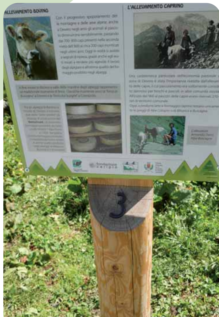
UNO DEI CIPPI IN LEGNO IDENTIFICANTI LE STAZIONI DEL PERCORSO

3 Un percorso con le medesime caratteristiche è poi in corso di allestimento presso il Lago Kastel, in alta Val Formazza. Il sentiero del Lago Kastel, realizzato in collaborazione con ENEL, è dedicato agli aspetti floristici e vegetazionali di un'area di grande interesse naturalistico. Qui, 10 stazioni tematiche vi condurranno attraverso le caratteristiche degli ambienti prativi d'alta quota. Anche il percorso del Lago Kastel sarà presto fruibile attraverso l'utilizzo di guide multimediali, a disposizione degli utenti in modalità podcasting attraverso i siti istituzionali dell'Ente gestore delle aree protette dell'Ossola www.cariplovegliadevero.it www.parcovegliadevero.it