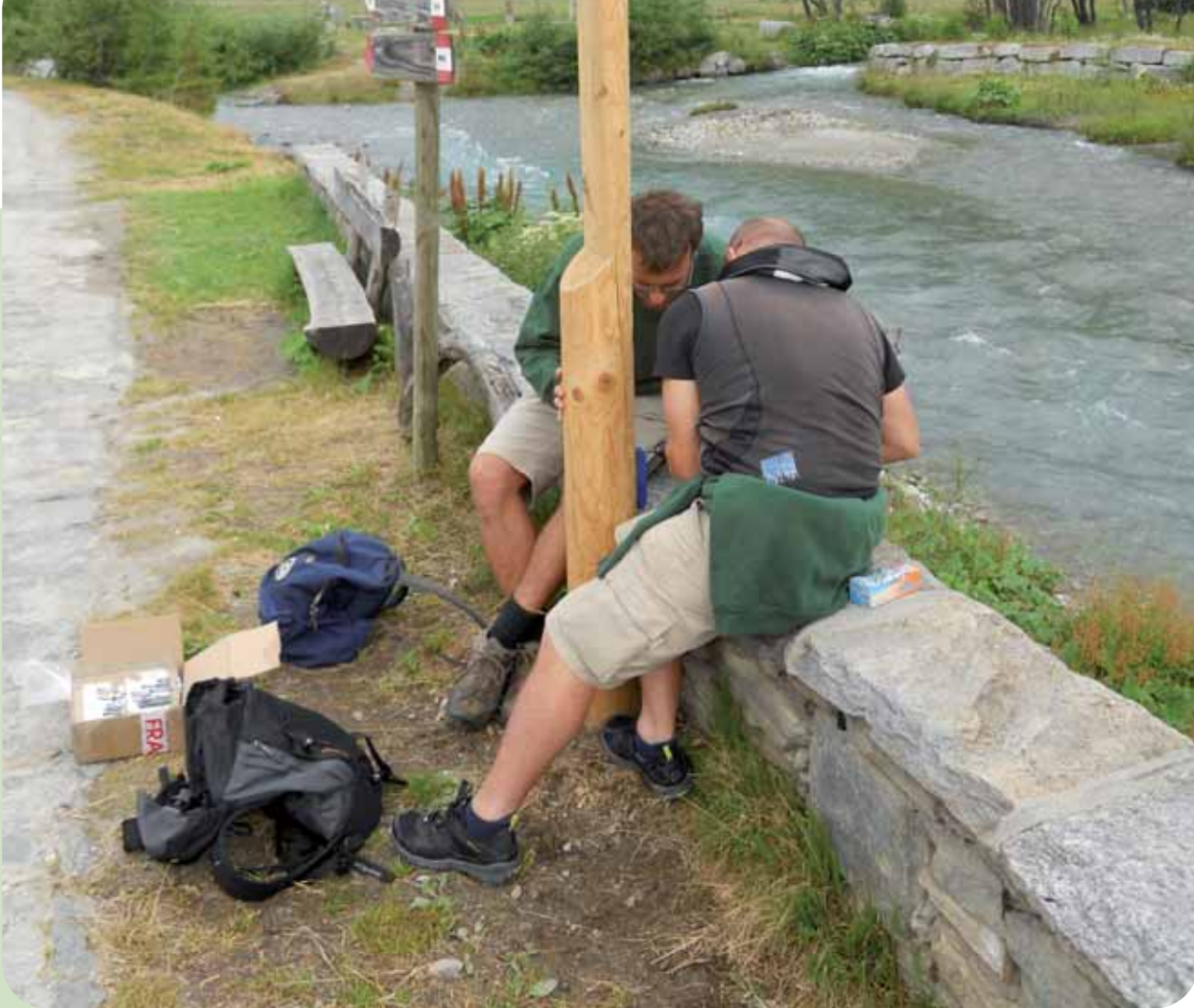
LE OPERAZIONI DI ALLESTIMENTO DELLE STAZIONI DEL PERCORSO MULTIMEDIALE, NELLA PIANA DI DEVERO

3 Un percorso con le medesime caratteristiche è poi in corso di allestimento presso il Lago Kastel, in alta Val Formazza. Il sentiero del Lago Kastel, realizzato in collaborazione con ENEL, è dedicato agli aspetti floristici e vegetazionali di un'area di grande interesse naturalistico. Qui, 10 stazioni tematiche vi condurranno attraverso le caratteristiche degli ambienti prativi d'alta quota. Anche il percorso del Lago Kastel sarà presto fruibile attraverso l'utilizzo di guide multimediali, a disposizione degli utenti in modalità podcasting attraverso i siti istituzionali dell'Ente gestore delle aree protette dell'Ossola www.cariplovegliadevero.it www.parcovegliadevero.it