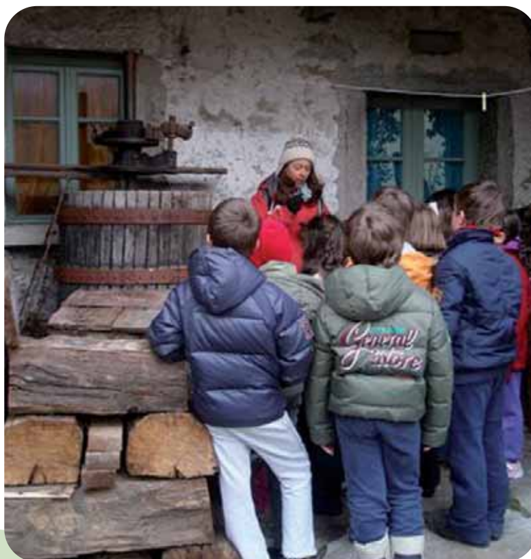
UN MOMENTO DELLE ATTIVITÀ DIDATTICHE CON LE SCUOLE PRESSO LA LATTERIA SOCIALE DI PREMIA

UNA CLASSE ASCOLTA LA SPIEGAZIONE DURANTE UN'USCITA DEI PERCORSI DI EDUCAZIONE AMBIENTALE