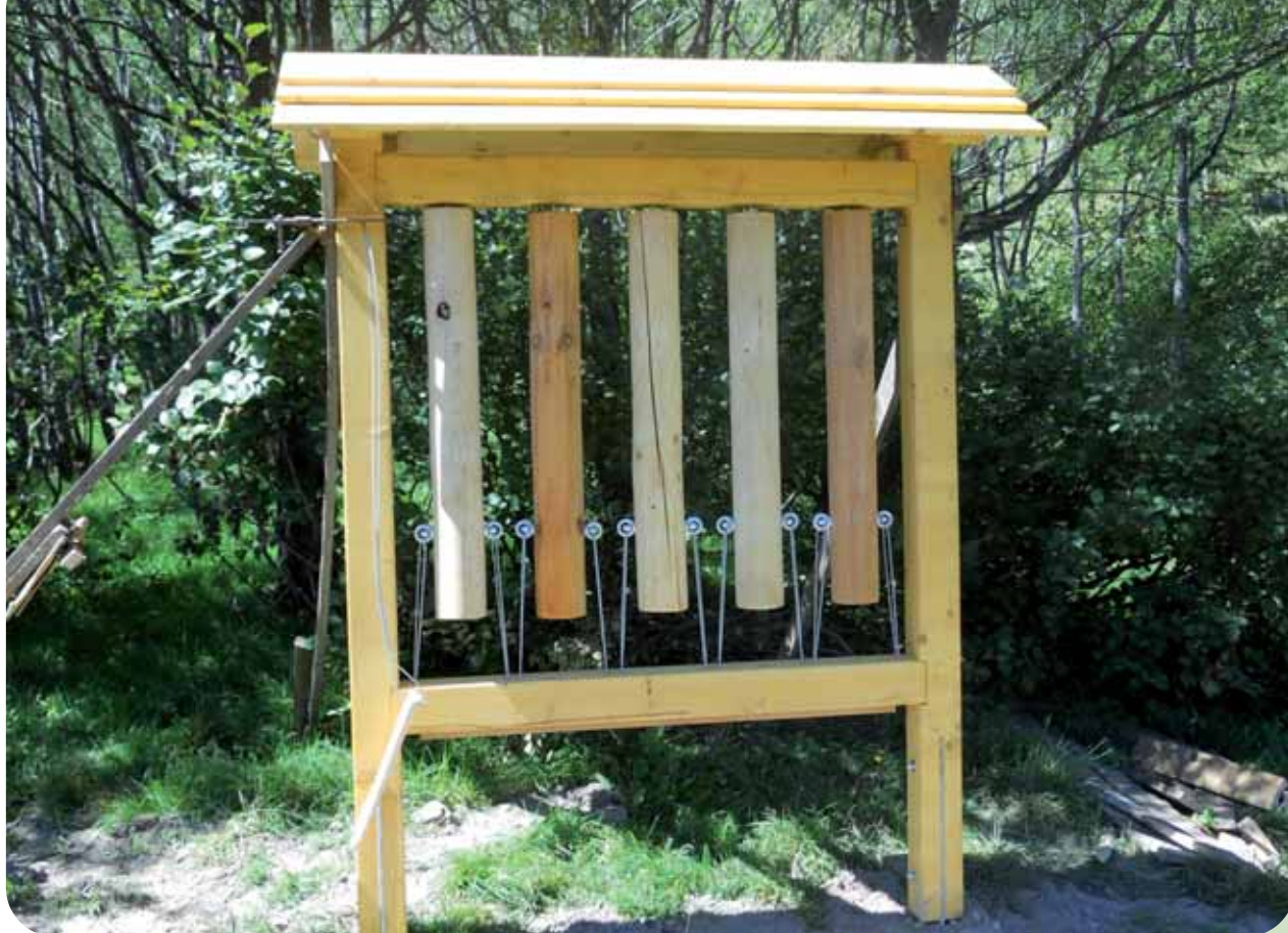
IL "DENDROFONO", UNO DEGLI ALLESTIMENTI SENSORIALI DEL PERCORSO LUNGO LA PIANA DI DEVERO