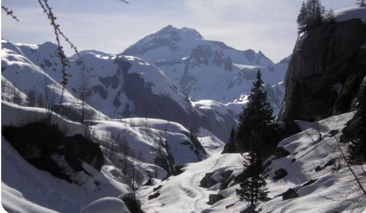
L'IMBOCCO DELLA VAL VANNINO (FORMAZZA), IN VESTE INVERNALE